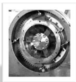
Σπαστήρας ρυθμιζόμενος με μαχαίρια

Πλήρης τεχνική υποστήριξη και οδηγίες ποιοτικής ελαιοποίησης.